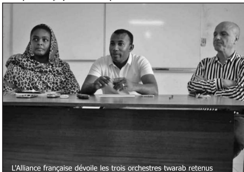
L'Alliance française dévoile les trois orchestres twarab retenus