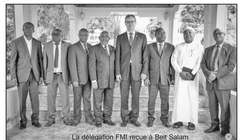
La délégation FMI reçue à Beit Salam

Le Président de la République Azali Assoumani a exprimé ses remerciements au nom des Comores pour la promptitude de réaction du Fonds Monétaire International, après le passage de Kenneth. « Bien évi-